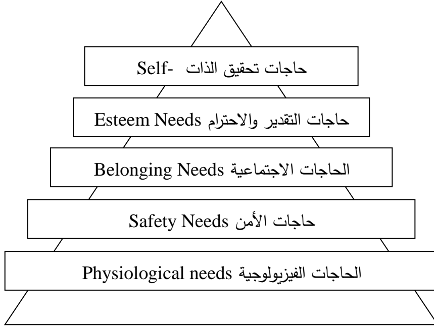
شكل رقم (3): مثلث ماسلو للاحتياجات الأساسية